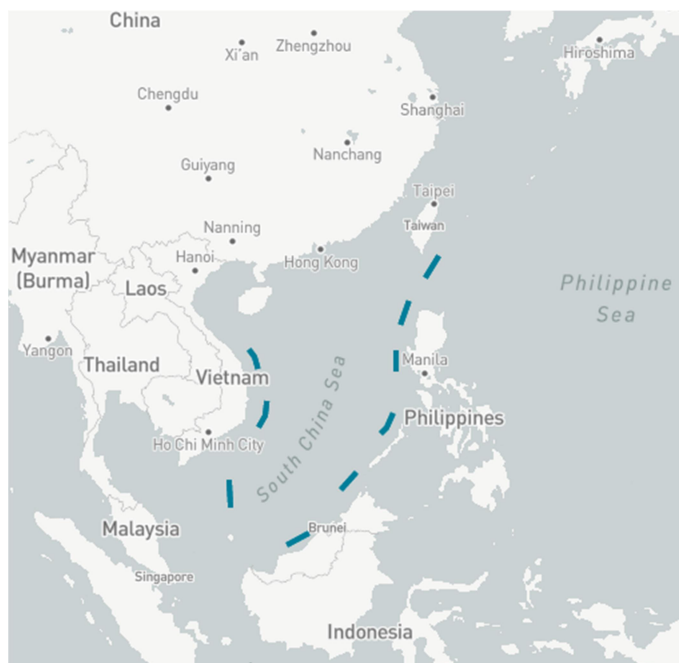
La " nine dash line "

Una di queste strategie passa, infatti, attraverso un saldo controllo del Mar Cinese Meridionale, che per la Cina è una periferia cruciale. Questa necessità è stata poi declinata in vere e proprie rivendicazioni territoriali: vi sono, infatti, numerose piccole isole, nella maggior parte piccoli atolli, rivendicati quasi in toto dalla Cina secondo la cosiddetta " nine dash line ".