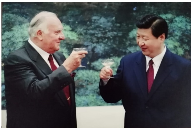
Brindisi tra il Vice Presidente peruviano Gianpietri e Xi Jinping in occasione della firma del Trattato di Libero Commercio (28 aprile 2009)

Un organismo con molti aneddoti che riflettono la volontà di dialogare, da quello di un passaporto APEC per i liberi spostamenti dei rappresentanti a quello dell'alternanza tra tavoli di riunione, allo stile occidentale a quelli quadrati, allo stile orientale. Lavori e sviluppi che hanno portato successivamente al Patto delle Americhe e al Trattato di Libero Commercio (TLC) con il Perù, che può rappresentare per l'Occidente un ingresso nel Pacifico e, per i paesi dell'area, l'ingresso alle Americhe con l'interesse, soprattutto della Cina, di sviluppare il corridoio (terrestre) transoceanico dalla costa peruviana alla costa atlantica brasiliana