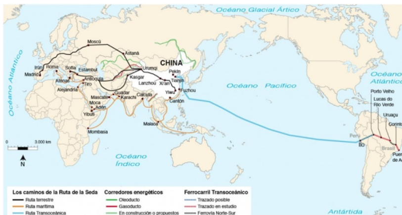
Le diverse vie della Seta nel mondo

Gli investimenti cinesi in America Latina si concentrano sui servizi nei settore finanziario, elettrico, delle energie rinnovabili, idroelettrico, portuale, dei trasporti, petrolifero e del gas, nonché minerario e dei metalli.