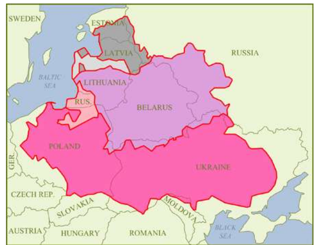
Confederazione polacco-lituana nel 1618, sovrapposto alla situazione geopolitica attuale.

La volontà polacca potrebbe essere mossa dalla memoria storica volta a ricostruire un'area di influenza, simile a quella indicata nella figura, che si estendeva quasi al Mar Nero. Un interesse di questo tipo potrebbe essere giustificato dalla vulnerabilità polacca a causa della sua posizione geografica posta al centro di dinamiche occidentali di matrice tedesca e orientali di matrice russa.