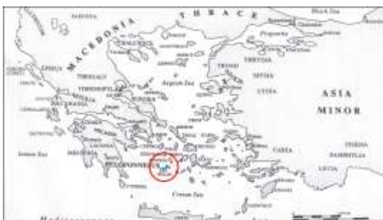
L'isola di Melo e la Grecia classica (figura tratta da: On the Origins of War di Donald Kagan)

"... ci danneggia di più la vostra amicizia, che non l'ostilità aperta: quella, infatti, agli occhi dei nostri sudditi, sarebbe prova manifesta di debolezza, mentre il vostro odio sarebbe testimonianza della nostra potenza" (Tuc. V, 95).