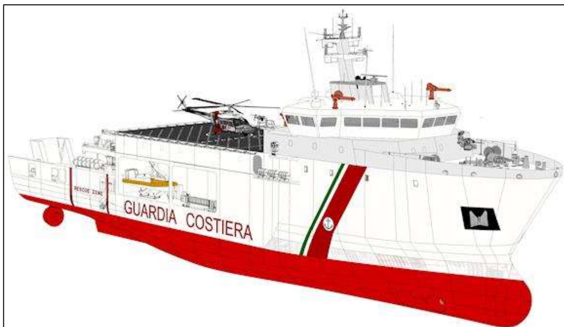
Fig. 4 – Nuova Unità d'altura multiruolo per la Guardia Costiera 9

La strategia marittima europea, focalizzata sulla Maritime Security , nonché recenti pubblicazioni 8 che analizzano le interrelazioni tra le Navies e le Coast Guards , soprattutto in materia di polizia d'alto mare, inducono in campo nazionale ad un'attenta riflessione sulle norme che oggi disciplinano le attività in mare da parte delle Forze Armate e delle Forze di Polizia, valutando prospettive di sviluppo comuni in un momento di estremo dinamismo nello scenario marittimo internazionale. Appare quindi opportuno ridefinire quell'insieme di norme, favorendo maggiormente l'integrazione (già prevista con la riforma Madia, ma mai attuata in toto da parte dei Ministeri competenti) tra la Marina Militare e il Corpo delle Capitanerie di Porto – Guardia Costiera.