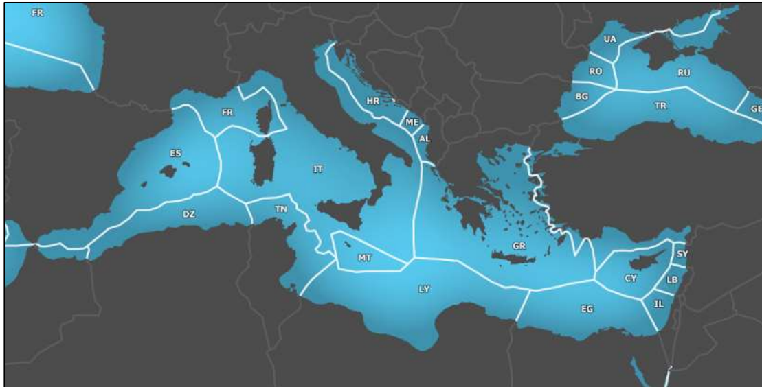
Fig. 6 – Zone Economiche Esclusive nel Mediterraneo 14

per non andare a influire sulla libertà di navigazione, è diventato rapidamente centrale nelle politiche degli stati rivieraschi in quanto la blue economy è apparsa una occasione da non poter trascurare. Conseguenza immediata di ciò è stata l'istituzione della Zona Economica Esclusiva da parte degli stati, al fine di sancire e rivendicare i propri diritti esclusivi sullo sfruttamento delle risorse del mare aumentando così il proprio peso politico nei confronti degli stati frontisti e adiacenti.