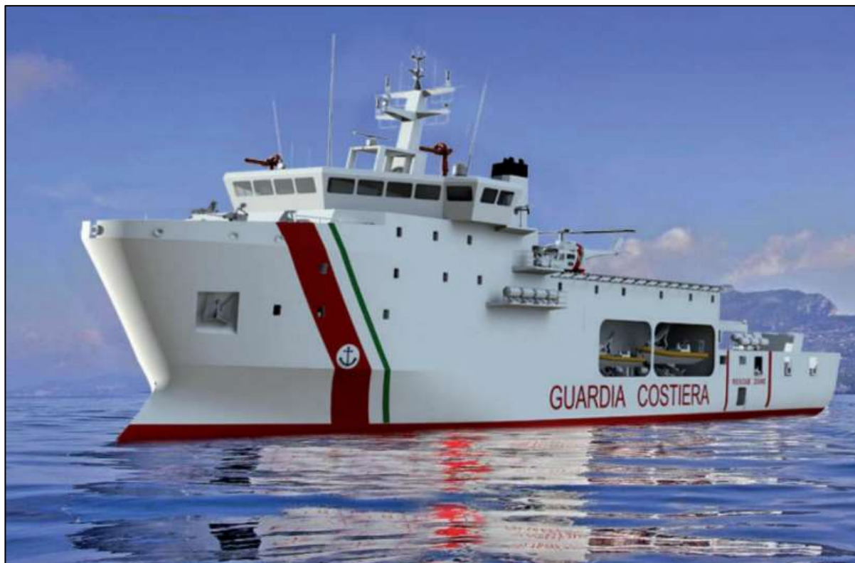
Fig. 8 – Rendering della nuova UAM Guardia Costiera

La sicurezza marittima è un elemento imprescindibile per uno Stato quale l'Italia, media potenza regionale marittima con interessi economici globali, che, a causa della sua posizione, risulta particolarmente esposta alle minacce provenienti dall'esterno. Un capillare law enforcement alturiero ed una credibile capacità expeditionary costituiscono, in questo senso, due strumenti particolarmente efficaci.