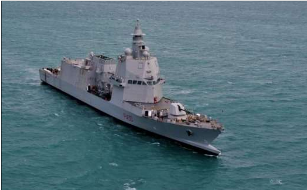
Fig. 5 – I sea trials del Pattugliatore Polivalente d'Altura Paolo-Thaon-di-Revel 12

a duplicazioni oppure a carenze, entrambe potenzialmente dannose sia dal punto di vista economico che istituzionale.