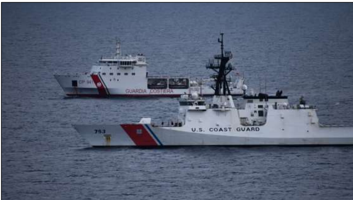
Fig. 1 - USCG Hamilton e Nave Diciotti in esercitazione congiunta 2

Il presente elaborato trae origine da alcune considerazioni sviluppate in ambito Centro di Studi di Geopolitica e Strategia Marittima (CeSMAR) in merito al progetto UAM, Unità d'Alta Multiruolo , un pattugliatore destinato alla Guardia Costiera, che, per dislocamento, sensori e capacità, può essere equiparato alle unità da pattugliamento già in uso alla Marina Militare. Il dibattito interno al CeSMAR sul progetto si è concentrato sui ruoli della Marina Militare e della Guardia Costiera, ha analizzato tesi ed antitesi, evidenziando possibilità di sinergie e rischi di duplicazioni, ed ha quindi fornito lo spunto per la sintesi illustrata nel presente elaborato. Con questo lavoro gli autori si propongono di analizzare il ruolo delle nuove unità d'altura della Guardia Costiera, alla luce dello scenario geopolitico e di considerazioni di carattere storico e giuridico, cercando di offrire al lettore due prospettive di studio complementari, una inerente la difesa e sicurezza in senso tout court , l'altra legata all'azione dello Stato in mare, ossia il law enforcement ; tali elementi sono peraltro estremamente connessi fra loro e trovano sintesi nell'approccio inter-agenzia e cross-settoriale della Sicurezza Marittima promosso con enfasi dall'Unione Europea 1 .