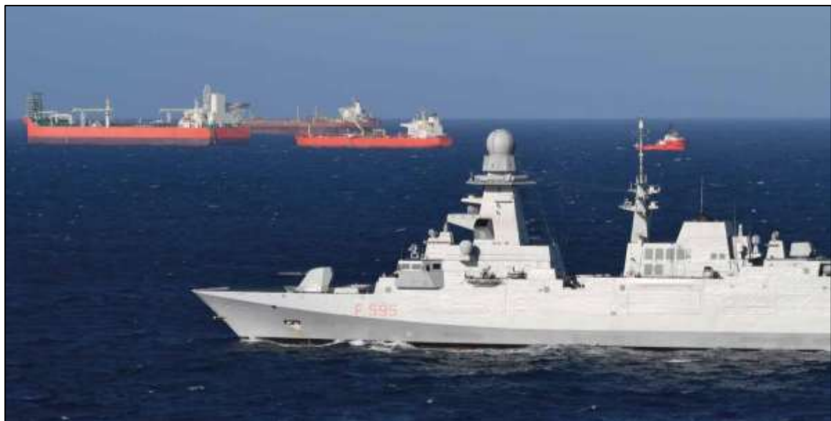
Fig. 7 – Nave Rizzo in pattugliamento nel Mediterraneo Centrale

Nella Zona Economica Esclusiva, il diritto internazionale attribuisce allo Stato costiero diritti sovrani relativi alla gestione ed allo sfruttamento delle risorse, biologiche e non, della colonna d'acqua (la pesca) e dei fondali marini (risorse minerarie, depositi di gas e di idrocarburi), ma anche diritti connessi con la conduzione di altre attività economiche, come la produzione di energie rinnovabili a partire dall'acqua, dalle correnti marine o dai venti, e di ricerca scientifica, nonché diritti e doveri di protezione dell'ecosistema marino 19 . Nella ZEE, nell'esercizio dei propri diritti sovrani di esplorazione, sfruttamento, conservazione e gestione delle risorse biologiche, lo Stato costiero esercita quindi poteri di polizia, adottando tutte le misure previste dai regolamenti e dalle proprie leggi, anche mediante il fermo, l'ispezione e l'eventuale sequestro delle unità straniere che violano le leggi del medesimo Stato.