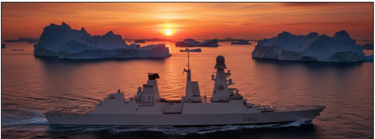
DDG classe Doria immaginato in un contesto polare artico.

I contributi sono diretta responsabilità degli autori e ne rispecchiano le idee personali. Le foto presenti in questo commento sono state di massima prese dal web, citandone sempre la fonte. Se qualcuno dovesse ritenere necessario rimuoverle o modificarne gli autori, può contattarci sul sito cesmar.it e sarà prontamente accontentato. La riproduzione, totale o parziale, è autorizzata a condizione di citare la fonte.